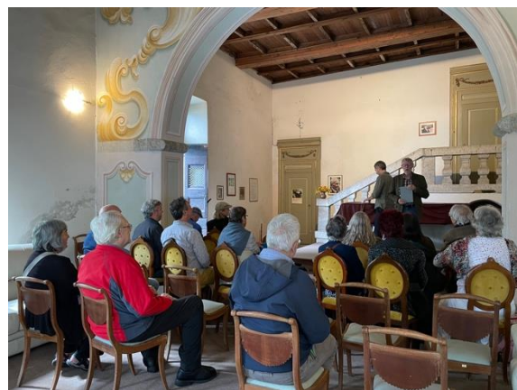
Figure 4 - Letture presso Sala Tallone (Villa Brault)