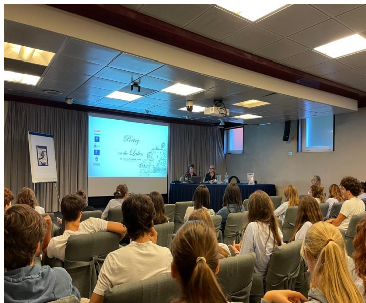
Figure 2 - letture di Dama Carol Ann Duffy in presenza di tutti gli studenti