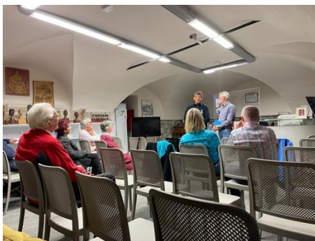
Figure 7 - Letture presso Villa Bossi con il Sindaco di Orta San Giulio