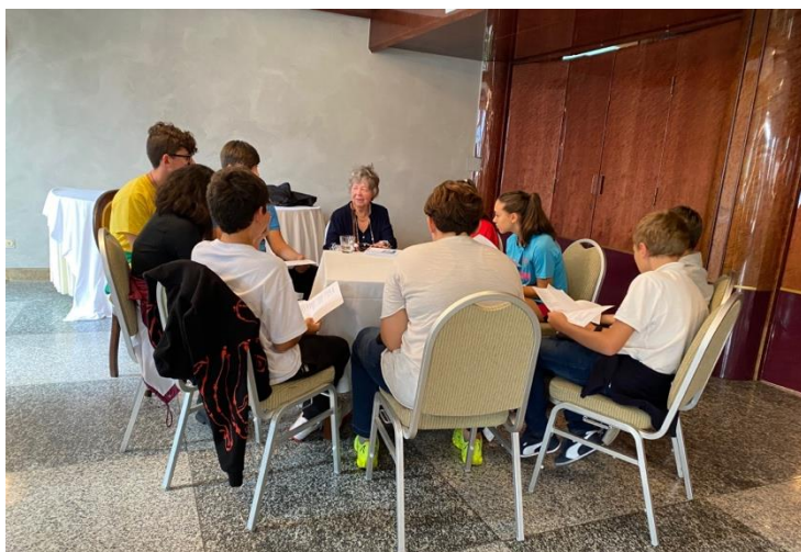
Figure 3 - Workshop creativi con gli studenti