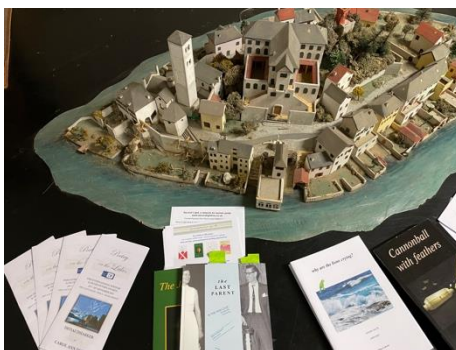
Figure 6 - Scambio di libri